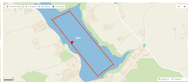
Okruh 2 km